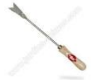
Désherbeur manuel (langue de serpent)