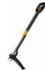
Désherbeur télescopique Fiskar

Laiteron des champs et Plantain majeur adorent les sols argileux, compacts qui se drainent lentement.