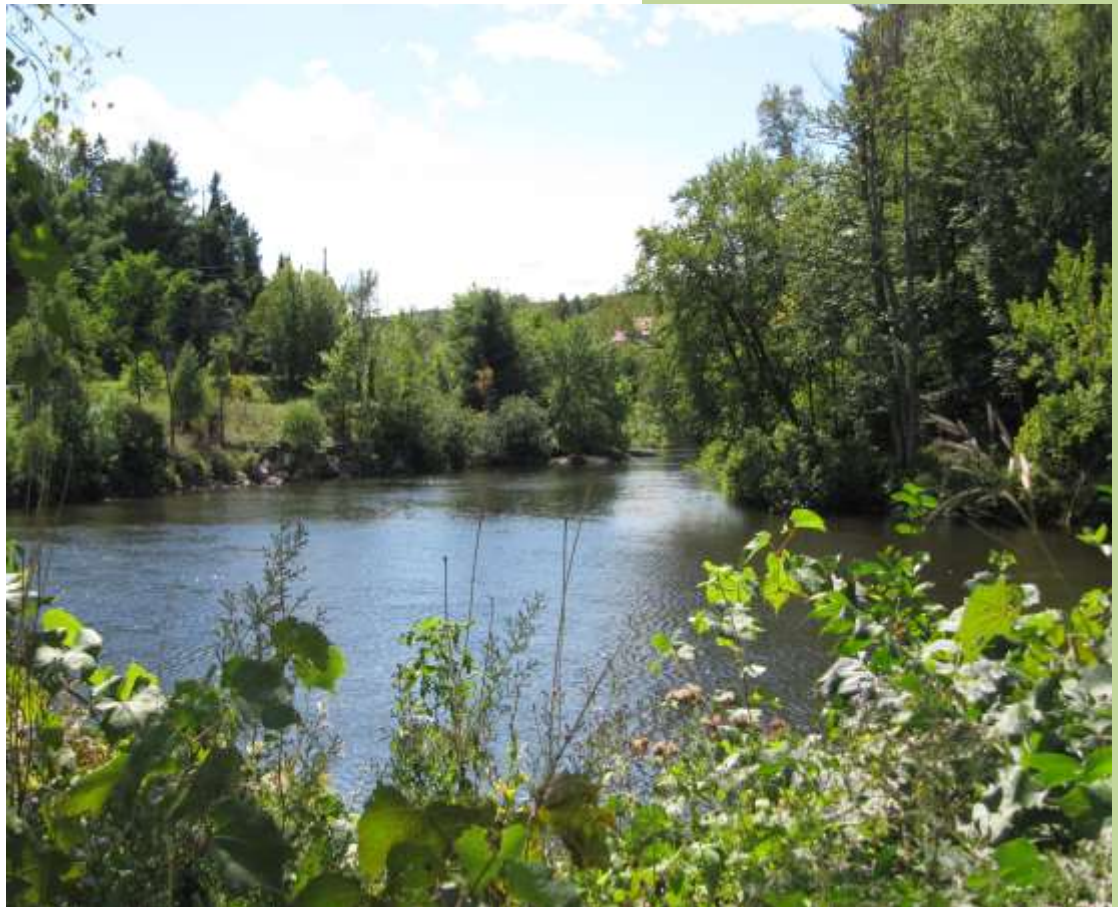
Rivière du Nord (près du Parc linéaire – chemin de la Rivière)