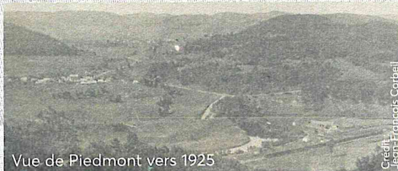
Vue de Piedmont vers 1925