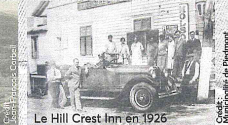
Le Hill Crest Inn en 1926