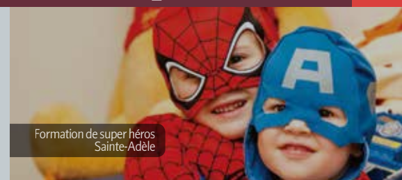
Formation de super héros Sainte-Adèle