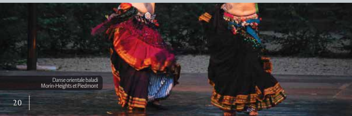
Danse orientale baladi Morin-Heights et Piedmont